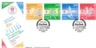
貼有一套四枚郵票並以特別郵戳蓋銷的首日封