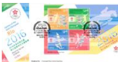
貼有一張小全張並以特別郵戳蓋銷的首日封